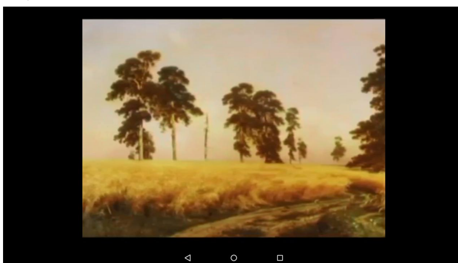
Рисунок 3 – Демонстрация видеоролика об экспонате

Видеоролик об экспонате запускается сразу после считывании информации QR кода (рисунок ).