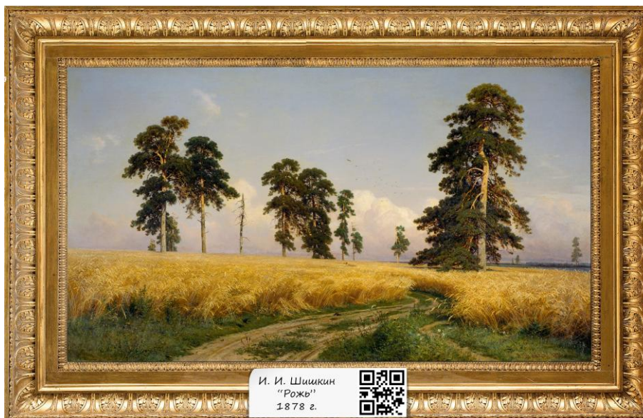
Рисунок 2 – пример расположения QR кода в экспозиции

Приложение распознает только QR коды добавленные в базу «QRМuseum».